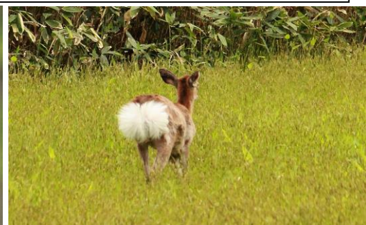
モモンガ巣穴にアオダイショウが・・・ 6月～モモンガ・暑くて出たい入りたい・・・ エゾシカ・危険が迫るとお尻の毛が逆立ちます