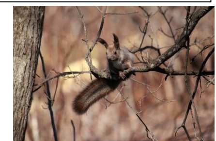
エノリス～風が強く必死でつかまっています