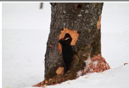
上川町内公園にクマゲラ飛来