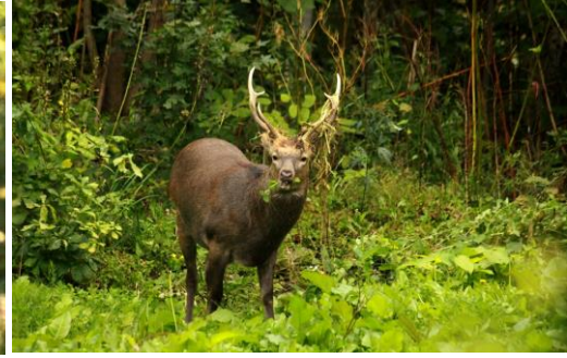
でしたが、草紅葉は見事な色付きでした 林道を曲がると目前にヒグマが… 10月～夢中で草食。角にも枯れ草が