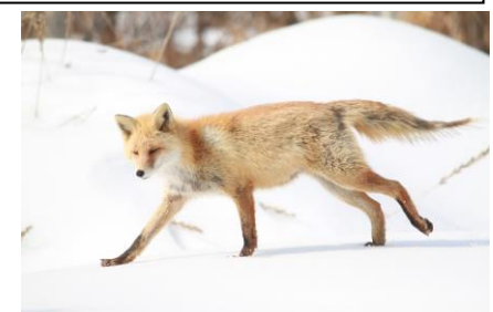
疥癬病にかかったキタキツネ・悲しい・・・