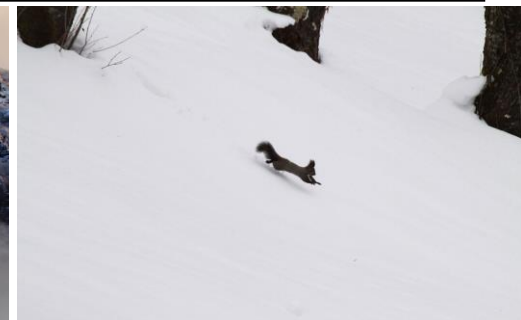
11月～大雨の影響で幻の滝・九十九滝現る 峡谷上部に雪が被りました 12月～初旬は暖冬でエゾリスも終日活動