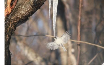
3月～樹液つららぺろっ コガラ