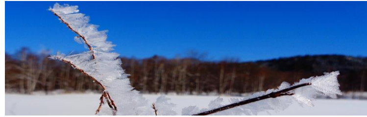
1月～フロストフラワー・霧氷