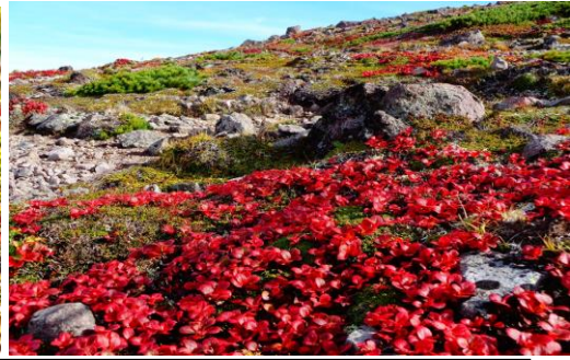
8月～シーズン初めは少なかったナキウサギ ギンザンマシコ・今年は多数飛来しました 9月～十十カマドは橙色主体→