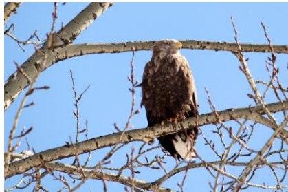
2月～オジロワシ 越冬したようです