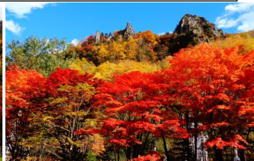
お山の紅葉は今一つでしたが、山麓の紅葉は例年通り綺麗に色付きました