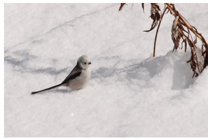
シマエナガ・雪の上で休憩中