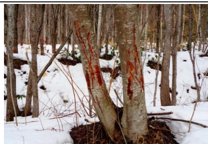
エゾシカの角研ぎ痕