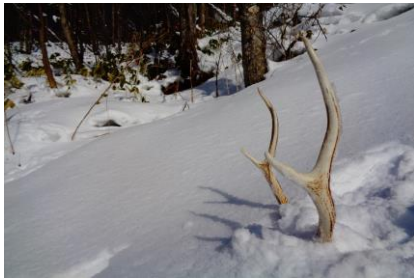
エゾシカ角・雪の下は・・・