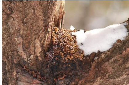
エゾモモンガフン・バレバレ～