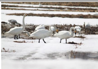
4月～上川町内に今年もハクチョウが