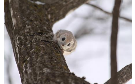
既に見下ろされていました