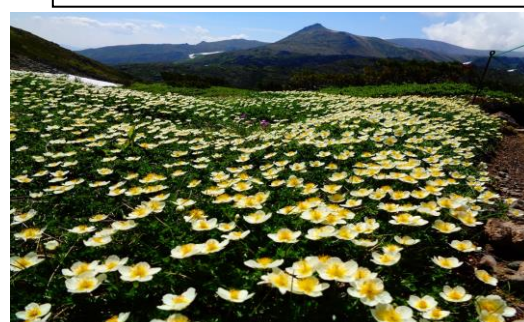
7月～今年のお花は種類によっては当たり年でした。キバナシャクナゲ・イワヒゲ