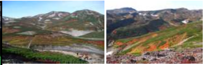
黒岳頂上・石室周辺 (8月下旬～9月初旬)