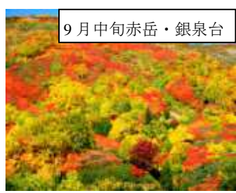
9月中旬赤岳・銀泉台