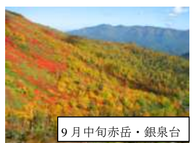
9月中旬赤岳・銀泉台