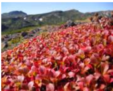
写真: ウラシマツツジ ポン黒岳周辺