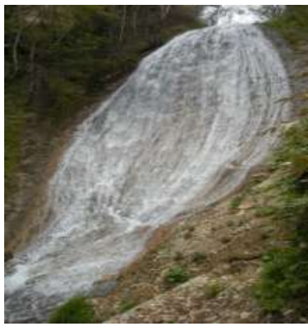
傾斜した岩盤を幾筋にも分かれて 流れ落ちる「分岐瀑」です。 【メロンの滝】

■ 大雪山麓を歩く：白川メロンの滝 ■ 【内容】 国立公園山麓地域の新たな景勝地を訪ねます。 【日時】 11月4日 9:30~13:00 【募集】 15名