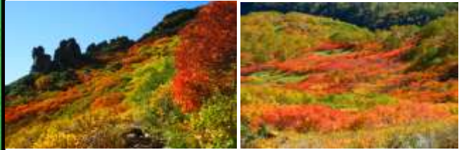
黒岳九合目周辺 (9月初旬～中旬)