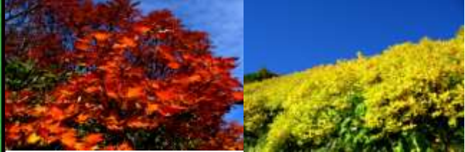
黒岳八合目周辺 (9月中旬～)