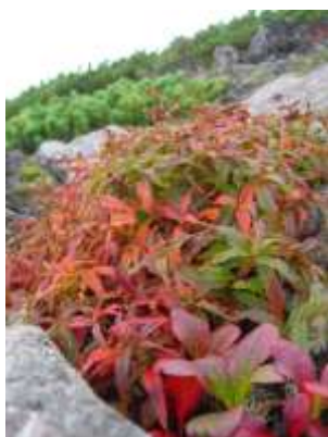
写真: 黒岳山頂直下のヒメイワタデ・ポン黒岳のウラシマツツジ