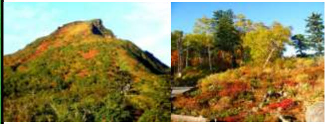
黒岳五合目周辺 (9月中旬～下旬)