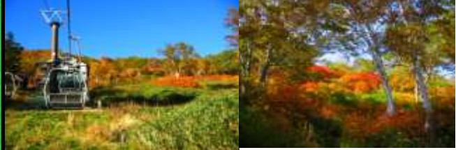
黒岳七合目周辺 (9月中旬～)