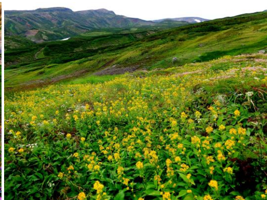
写真(左から) : チングルマ・エゾコザクラ・ミヤマアキノキリンソウ