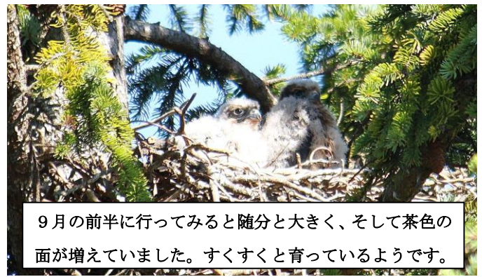
9月の前半に行ってみると随分と大きく、そして茶色の面が増えていました。すくすくと育っているようです。