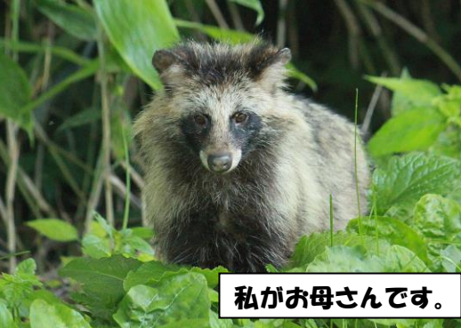
私がお母さんです。