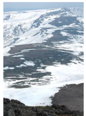
⑧白雲岳山頂から見た高根が原

⑥白雲平の湖は4月下旬から5月上旬にかけて好天が続いた影響で雪解け水が地下に浸透してかなり縮小していた。⑦旭岳山頂周辺も全面雪（手前左は後旭岳・右奥は旭岳）⑧白雲岳避難小屋から高根が原分岐にかけてはまだ多くの残雪があるのでガスなどが発生すると方向を見失う場合があるので十分注意して下さい。