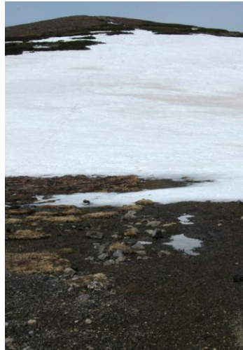
①北海平から見た北海岳