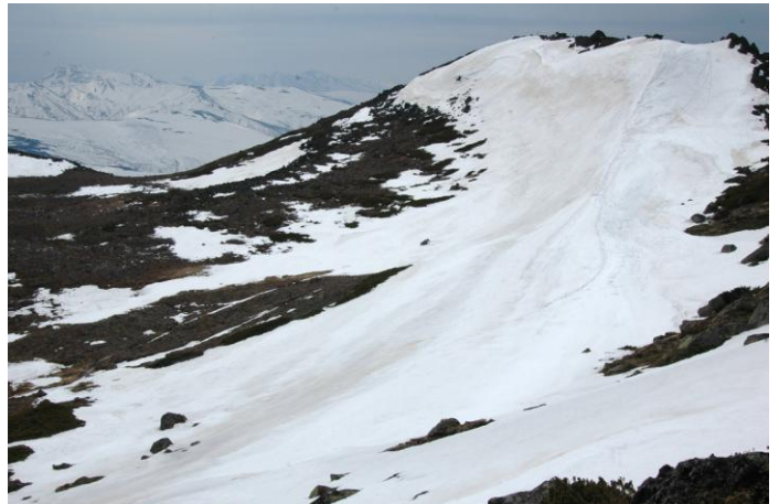
⑤白雲岳山頂周辺とトムラウシ（左奥）

①②北海平の雪渓はまだ半分以上残り、雪解けた所は水が溜まりぬかるみ非常に歩きづらい。③花の沢も全面雪渓。④小屋周辺は雪解けしていた。⑤山頂周辺の日中の雪質は膝まで埋まるほどで非常に歩きづらい状態。