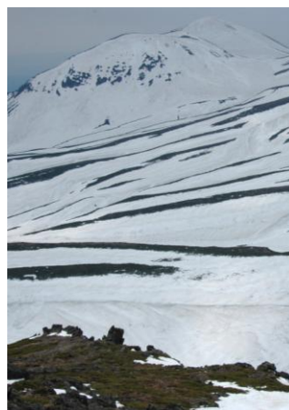
⑦山頂から見た旭岳方面