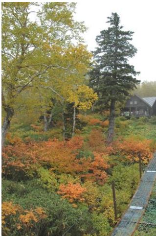
①黒岳7合目リフト乗降場

【黒岳 3～4 合目】ナナカマド (色づいてきた) 【5～6 合目】ナナカマド (かなり色づく) 【7～8 合目】ナナカマド (見頃) ダケカンバ (色づいてきた) 【9 合目～マネキ岩】ナナカマド (一部落葉目立つがまだ見頃) 【黒岳山頂～ポン黒】ナナカマド (落葉目立つ) 【雲の平】ナナカマド (見頃だが落葉も目立つ) 【赤石川～北海沢】見頃