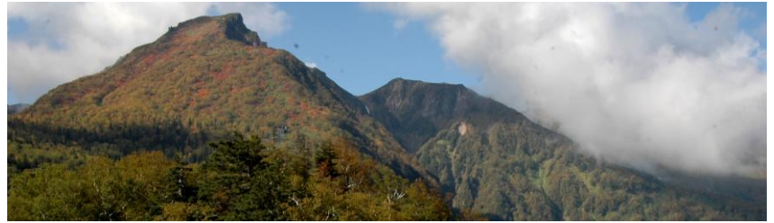
黒岳 5 合目展望台から見た表大雪山

【黒岳 3～4 合目】ナナカマド (色づいてきた) 【5～6 合目】ナナカマド (かなり色づく) 【7～8 合目】ナナカマド (見頃) ダケカンバ (色づいてきた) 【9 合目～マネキ岩】ナナカマド (一部落葉目立つがまだ見頃) 【黒岳山頂～ポン黒】ナナカマド (落葉目立つ) 【雲の平】ナナカマド (見頃だが落葉も目立つ) 【赤石川～北海沢】見頃