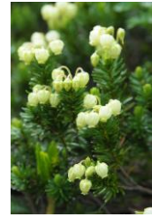
アオノツガザクラ

【9合目】ダイセツトリカブト○、チシマノキンバイソウ○、トカチフウロ↓、カラマツソウ○、ウコンウツギ↓、【黒岳山頂】イワギキョウ○、コマクサ↓、ミヤマキンバイ↓、チシマツガザクラ○、【北海沢】キバナシャクナゲ○、エゾノツガザクラ○、エゾコザクラ○、チングルマ○、アオノツガザクラ○、イワブクロ○、イワウメ○、ミネズオウ○