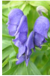
ダイセツトリカブト