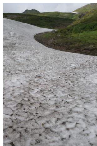
⑦北海沢ベンチ周辺