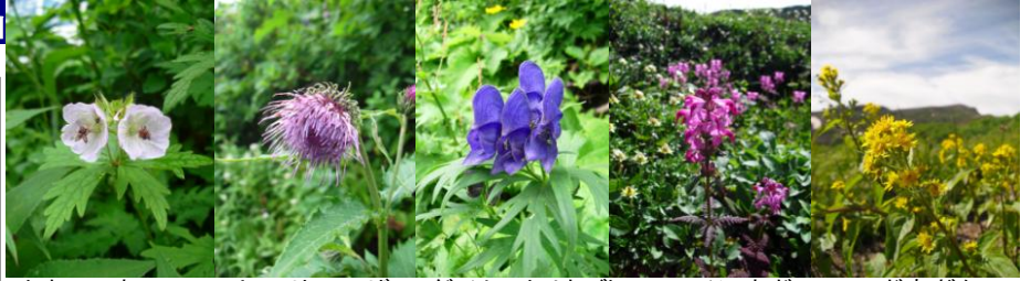
トカチフウロ ミヤマサワアザミ ダイセツトリカブト ヨツバシオガマ コガネギク

【黒岳七八合目】ウメバチソウ、ウコンウツギ、モミジカラマツ、ヤマハハコ【黒岳九合目・山頂】コガネギク、ダイセツトリカブト、ミヤマサワアザミ、トカチフウロ【石室周辺】チングルマ、ヨツバシオガマ、エゾツガザクラ、ミヤマキンバイ【雲ノ平】ミヤマリンドウ、コガネギク、ヨツバシオガマ、イワブクロ【赤石川周辺】チングルマ、エゾツガザクラ等々