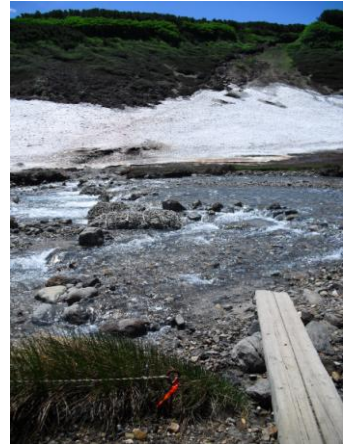
⑤ 雲の平(奥は烏帽子岳)