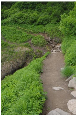
①第一花園看板手前

【第1花園】ウメバチソウ、ウサギギク○、コガネギク○、チングルマ【コマクサ平】クモイリンドウ【第4雪渓】ミヤマリンドウ、ヨツバシオガマ○、ウサギギク○【赤岳山頂～白雲岳分岐】ヒメイワタデ、ウラシマツツジが色づき始める。