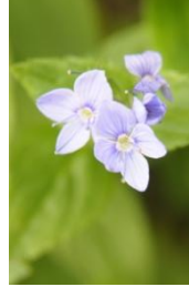
エゾヒメクワガタ