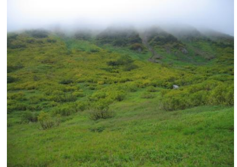
大学沼から高根ヶ原斜面