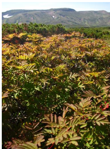
⑥ 雲の平周辺(後方・北海岳)