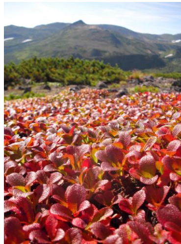
③ ポン黒岳周辺(後方・烏帽子岳) ④ 黒岳石室周辺(後方・白雲岳)