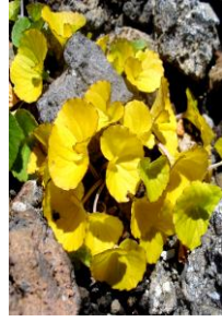
エゾタカネスミレ