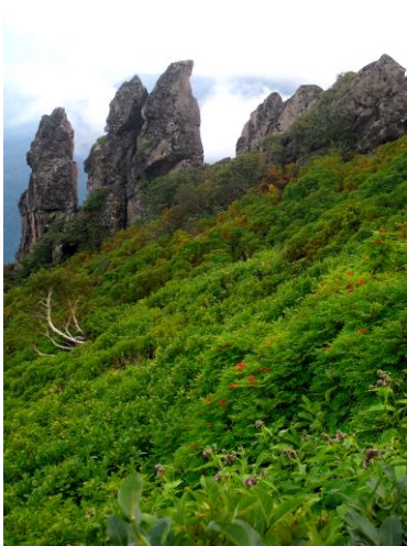
① 黒岳九合目(まねき岩)

【頂上周辺～石室周辺】イワギキョウ〇ミヤマアキノキリンソウ、エゾオヤマリンドウ等々