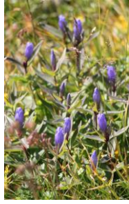
エゾオヤマリンドウ