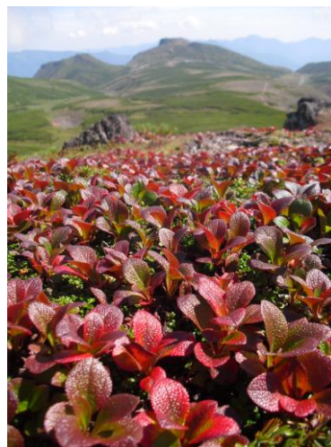
⑦ お鉢平周辺(後方・黒岳)