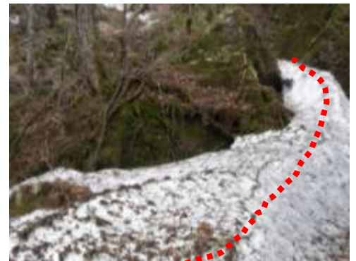
紅葉滝 (上) と手前の残雪