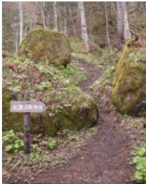
左は赤石川へ。散策路は直進します。