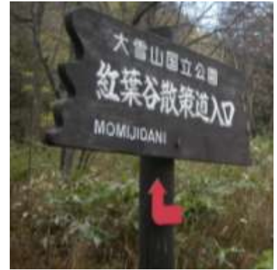
入口の看板: 左から順番に案内看板があります