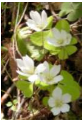
コミヤマカタバミ