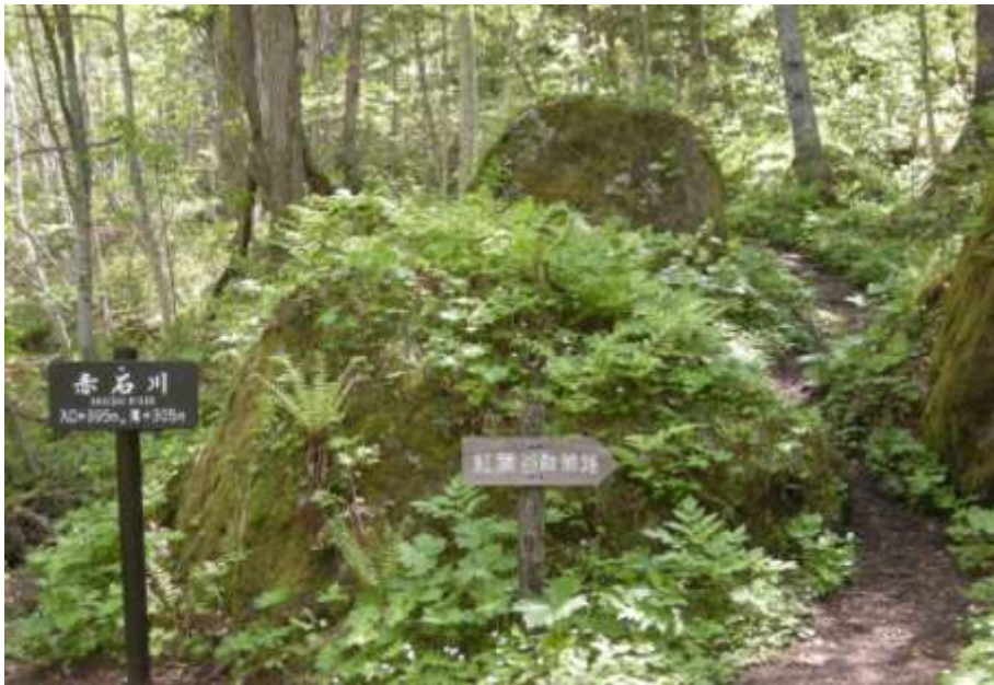
左は赤石川へ。滝へは散策路を直進します。