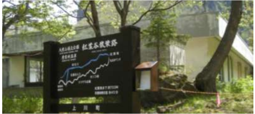
入口の新しい看板：横の箱にはガイドマップが入れてあります