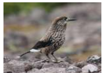
⑧ギンザンマシコ(上)ホシガラス(下)

⑤⑦山頂周辺から石室手前までの雪は消雪。石室はほぼ露出しました。(昨年は屋根のみ)6/9より管理人雪割り開始。⑥例年、残雪が多い北鎮岳分岐付近は全面雪。雲の平も所々大きな雪渓があり、視界不良時は地図等の携行が必要です。⑧五合目から石室に至るまで、野鳥の声・姿多数。この日は、ギンザンマシコ・ホシガラス・ノゴマ・カッコウが多く見られました。前回情報時は、ナキウサギの声は聞かれませんでした。今日は少ないものの「ピッチ」という高い声が聞かれました。お花も前回情報時から花数が増えてきました。