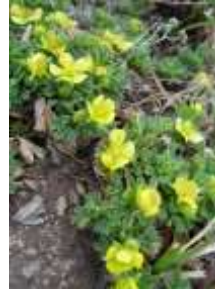
メアカンキンバイ