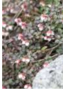
コメバツガザクラ