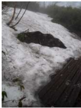
① 黒岳登山事務所付近

【八合目】 ショウジョウバカマ 【九合目】 エゾイワハタザオ、ショウジョウバカマ、ジンヨウキスミレ 【頂上～ポン黒】 コメバツガザクラ、ミネズオウ、キバナシャクナゲ、メアカンキンバイ、ミヤマキンバイ、ウラシマツツジ、ガンコウラン