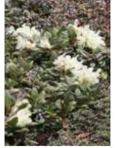
キバナシャクナゲ

【八合目】 ショウジョウバカマ 【九合目】 エゾイワハタザオ、ショウジョウバカマ、ジンヨウキスミレ 【頂上～ポン黒】 コメバツガザクラ、ミネズオウ、キバナシャクナゲ、メアカンキンバイ、ミヤマキンバイ、ウラシマツツジ、ガンコウラン