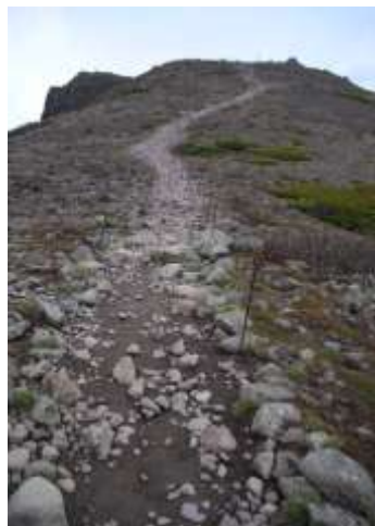
⑤ 黒岳山頂から石室へ

①登り始めから雪渓です。②標柱約1m露出。③標柱全露出。④標柱・ベンチ全露出。登り始めから九合目標柱付近まで全て雪の中です。九合目標柱から山頂直下に至るまで、4m・3m・30m・70mの雪渓があります。特に、最後の雪渓は急斜面であることと大変滑りやすくなっています。ストックは必需品であることと、スニーカー程度の靴では登頂は難しいです。装備を万全に安全山行をお願いします。