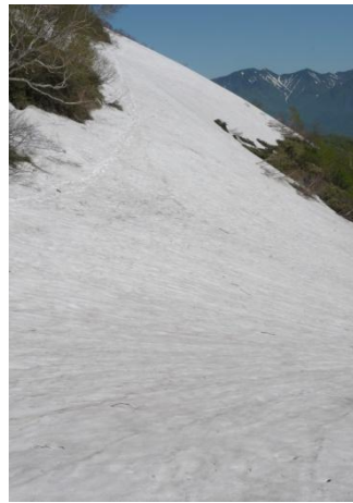
②第一花園看板周辺