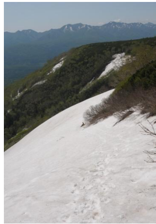
③第二花園展望台下