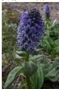
ホソバウルップソウ