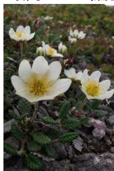
チョウノスケソウ