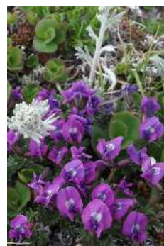
エゾオヤマノエンドウ