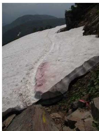
⑤エイコノ沢ガレ場

緑岳山頂から板垣分岐周辺にかけては、ホソバウルップソウやチョウノスケソウが見頃を迎えた⑦⑧一方で、エゾオヤマノエンドウ・イワウメなどは、すでに最盛期を過ぎ、枯れた花が目立つ。