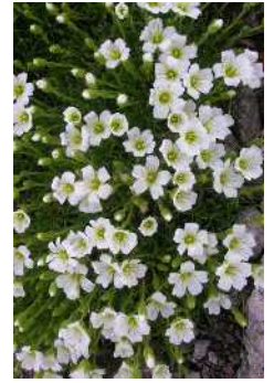
エゾタカネツメクサ