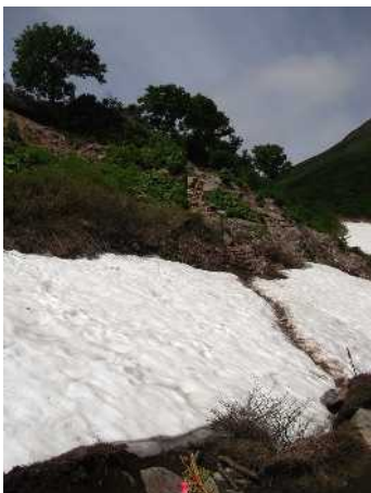
⑤エイコノ沢ガレ場

第一花畑端部に約100m①、第二花畑端部②からエイコノ沢ガレ場⑤にかけては、7つに分断された20mから50mほどの残雪が断続的につづく⑥。気温の低い朝方などは硬くなっているので、転倒に注意。第二花畑上部は登山道に融雪水が入りこんで歩きにくい。緑岳稜線ではチシマギキョウが咲きそろってきている⑦。