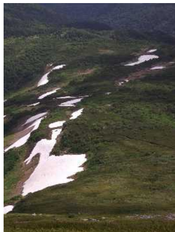
⑥山頂直下からの俯瞰