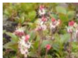
ダイゼットリカブト