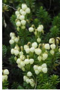
アオノツガザクラ