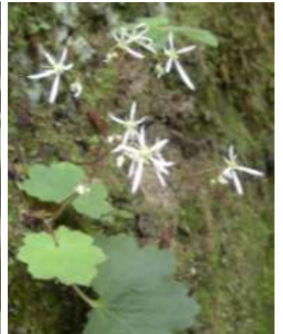
ダイヤモンドソウ