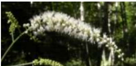
サラシナショウマ