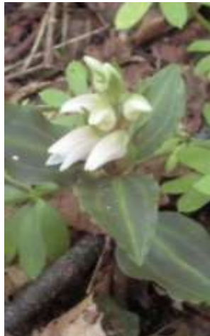
アケボノシュスラン