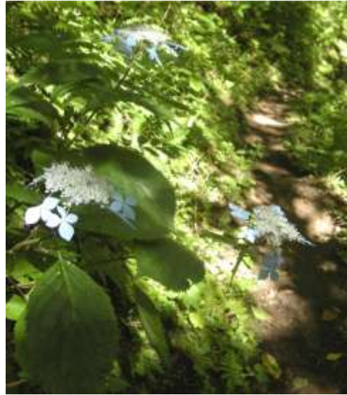
散策路に咲くエゾアジサイ