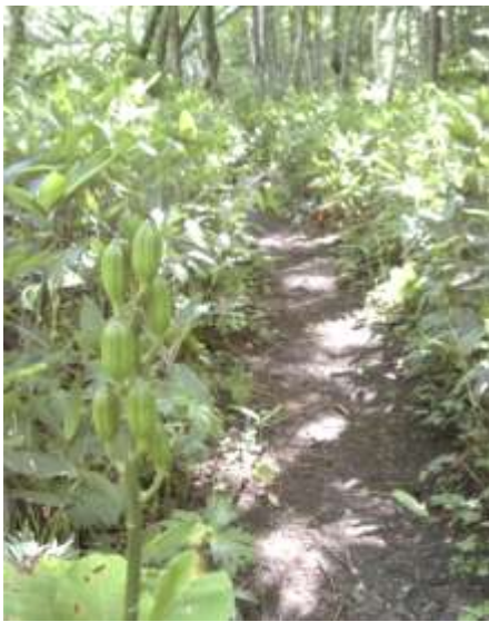
散策路とオオウバユリの種