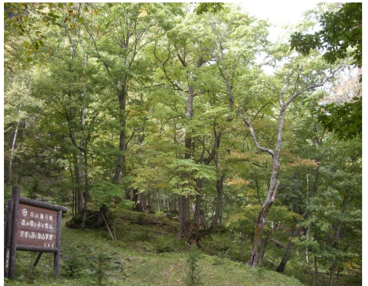
少し黄色くなったカツラ