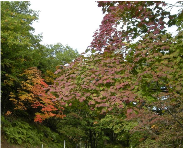
ヤマウルシ (左) ハウチワカエデ (右)