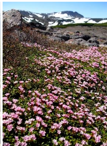
⑦ ポン黒岳(後方白雲岳)