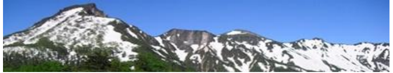
① 黒岳～上川岳全景 : 五合目展望台より 前回 6/8 情報時より確実に雪融けが進んでいます。