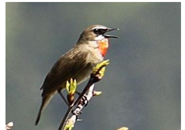
⑨ 上段ノゴマ 下段エゾユキウサギ