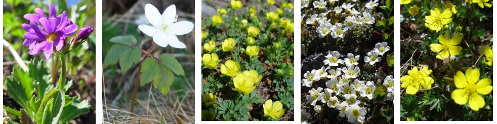
6/8 から新たに「エゾゴザクラ」「エゾイチゲ」～九合 「メアカンキンバイ」「イワウメ」「ミヤマキンバイ」～山頂 開花