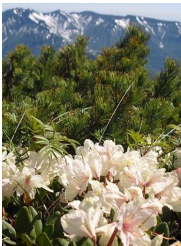
⑥ 黒岳山頂(後方ニセイカウシュツペ山)

②③七合目～八合目間は全面雪。表面は腐った部分と、凍った部分の入り混じり。八合目標柱約 70cm 露出。④九合目下部から頂上直下に至るまで、断続的に登山道露出しているが、ほぼ雪の中という状況に近い。⑤頂上直下の急斜面、滑落の危険が大きいです。急斜面を過ぎると、頂上から下、三曲がり目まで消雪。早朝など気温によっては雪面が凍りつく場合もあります。ストック・スパッツは必需品であることと、状況によっては、軽アイゼン等が必要です。スノーシューも場所によっては有効ですが、九合目上部からは効果が薄いです。