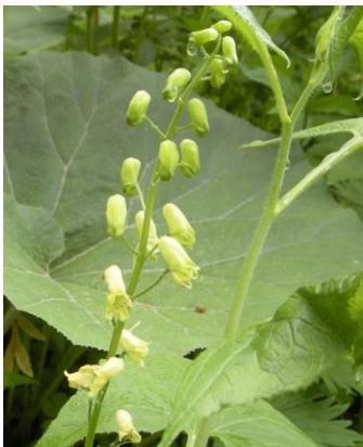
エゾノレイジンソウ