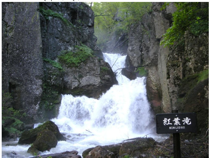
紅葉滝：雪解けの為、幅いっぱいには流れています