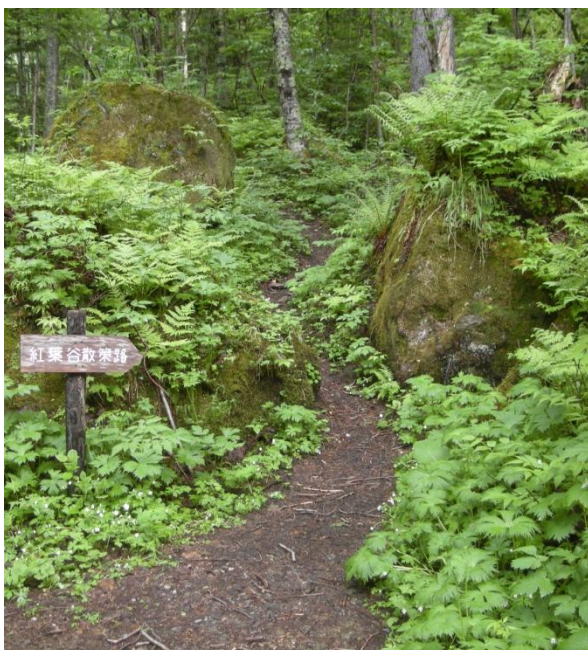
この看板から登りが始まります