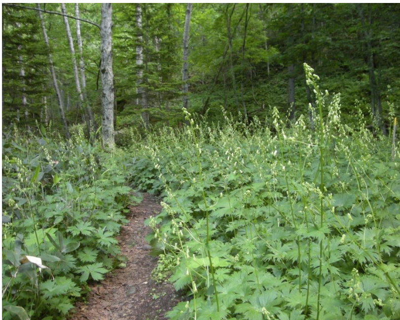
エゾノレイジンソウ群落