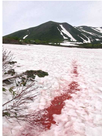
③第一花畑入口付近