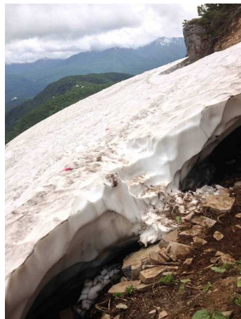
⑥エイコの沢ガレ場付近