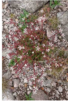
クモマユキノシタ