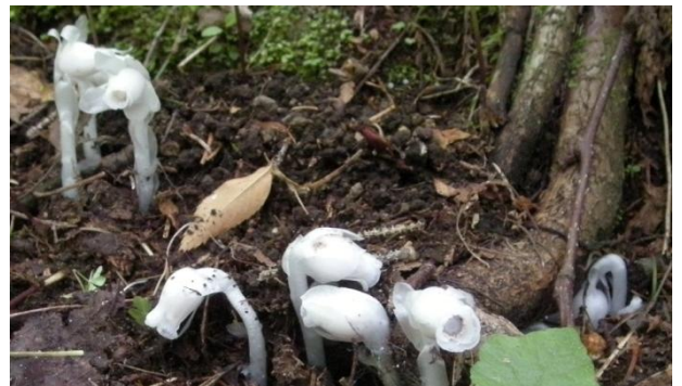
ギンリョウソウが道沿いに8株