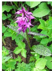
ウズラバハクサンチドリ