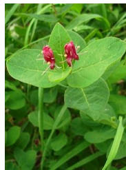
チシマヒョウタンボク