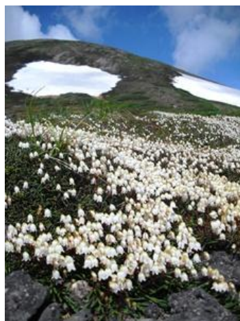
⑦ 北嶺岳分岐下周辺