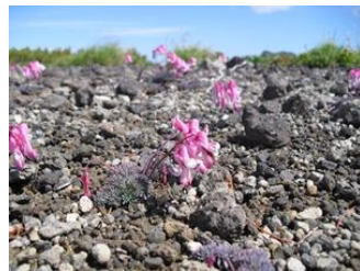
コマクサ(黒岳頂上～雲の平)

【七合目～頂上】サンカヨウ、エゾイチゲ、ショウジョウバカマ、エゾイワハタザオ、ミヤマハタザオ、ミヤマキンポウゲ、エゾノハクサンイチゲ、キバナノコマノツメ、ジンヨウキスミレ、ウコンウツギ、カラマツソウ、ハクサンチドリ、ウズラバハクサンチドリ、トカチフクロ、チシマノキンバイソウ、マルバシモツケ、チシマヒョウタンボク、ヨツバシオガマ 【頂上～雲の平】キバナシャクナゲ、メアカンキンバイ、ミヤマキンバイ、エゾコザクラ、コマクサ、エゾノツガザクラ、ヒメイソツツジ、エゾイワツメクサ、イワブクロ、イワヒゲ、エゾツツジ、コケモモ、ヨツバシオガマ、ミネズオウ、タカネオミナエシ、チングルマ、タカネスミレ、イワギキョウ他