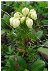
アオノツガザクラ