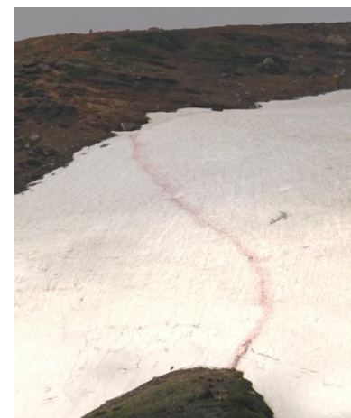
⑧ 北鎮岳分岐下雪渓

⑤雪渓上歩行可能。但し、上部から雪が落ちてきており、渡渉点まであとわずか。事前の情報収集を。川に向う登山道の露出が増えてきた。残りは平坦な部分に約30mの雪渓。ベンガラでルート確保してあるが、濃霧時要注意。⑥⑦部分的ではあるが、「キバナシャクナゲ」「エゾノツガザクラ」が広がってきた。⑧中間地点はまだ「隆起」しており、装備の充実は欠かせない。気象条件に左右されるが、雪面が硬く凍りつく場合もあり。／お花は昨年比、残雪の影響で遅れ有。場所にもよるが本日現在、九合・雲の平で約半月程度の遅れ。