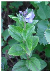
エゾヒメクワガタ