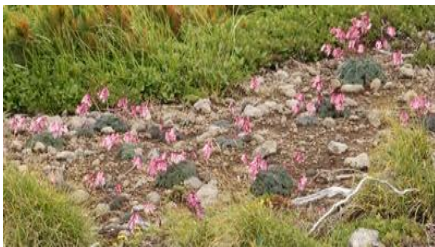
コマクサ(黒岳頂上～雲の平)

【七合目～頂上】エゾノレイジンソウ、エゾイチゲ、エゾイワハタザオ、ミヤマハタザオ、ミヤマキンボウゲ、エゾノハクサンイチゲ、キバナノコマノツメ、ジンヨウキスミレ、ウコンウツギ、カラマツソウ、ハクサンチドリ、ウズラバクサンチドリ、トカチフクロ、チシマノキンバイソウ、マルバシモツケ、チシマヒョウタンボク、ヨツバシオガマ、エゾヒメクワガタ 【頂上～雲の平】キバナシャクナゲ、メアカンキンバイ、ミヤマキンバイ、エゾコザクラ、コマクサ、エゾノツガザクラ、ヒメイソツツジ、エゾイワツメクサ、イワブクロ、イワヒゲ、エゾツツジ、コケモモ、ヨツバシオガマ、タカネオミナエシ、チングルマ、イワギキョウ、チシマツガザクラ、クモマユキノシタ他