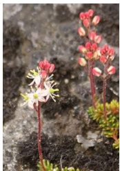
チシマツガザクラ