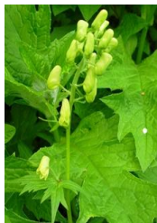
エゾノレイジンソウ