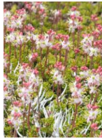
チシマツガザクラ