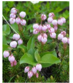
エゾノツガザクラ