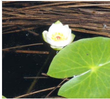
エゾベニヒツジグサ