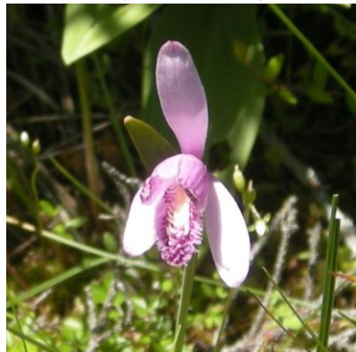
点々と咲くトキソウ