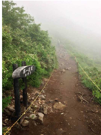
②第一花園看板付近