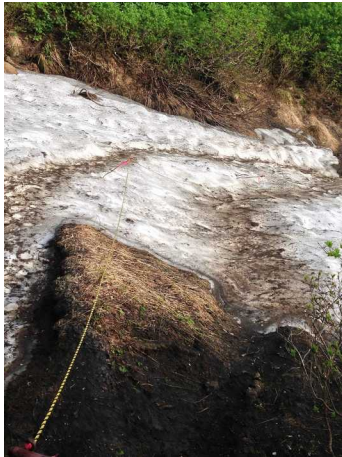
①第一花園入口付近