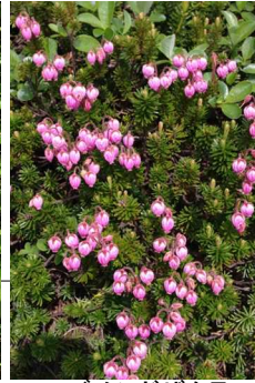
エゾノツガザクラ