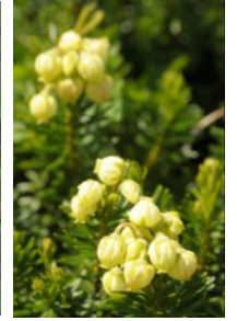
アオノツガザクラ