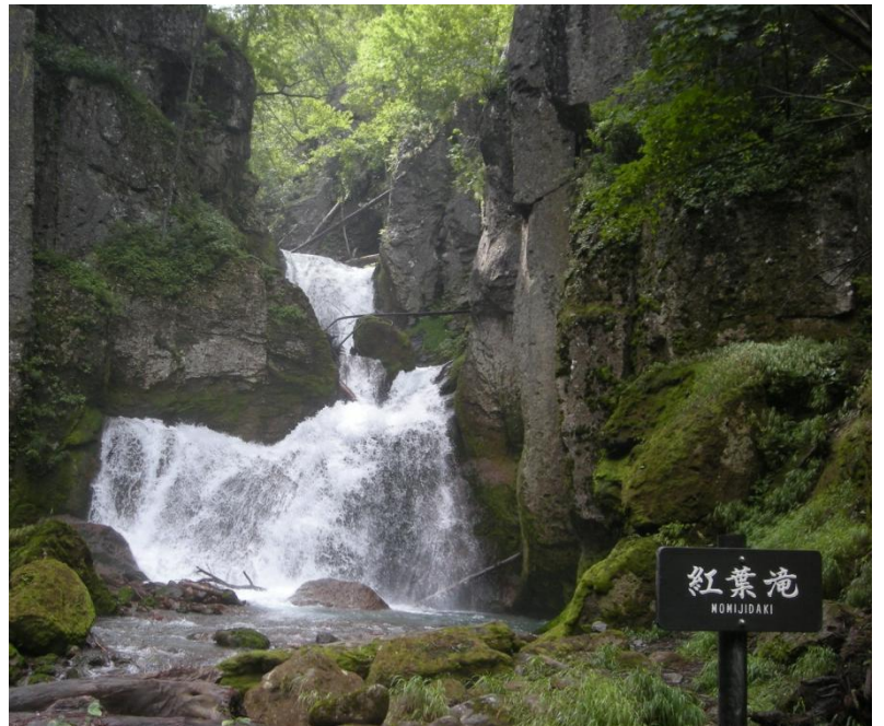
紅葉滝：冷たい水の飛沫が満ちています