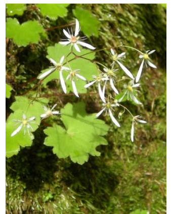
ダイヤモンドソウ