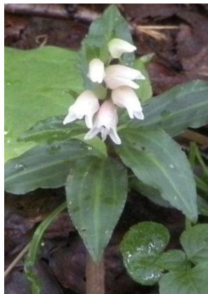
アケボノシュスラン