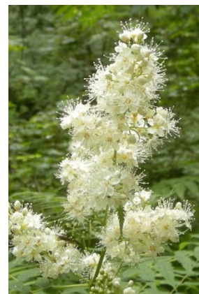
ホザキナナカマド