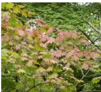
ハウチワカエデの色づき