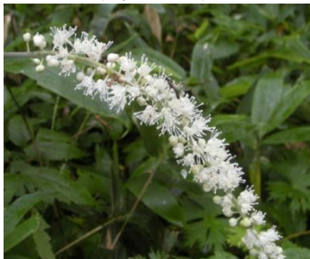
サラシナショウマ