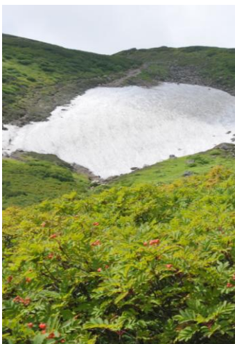
⑤ 第3 雪渓下部

② 第1 花園のナナカマド紅葉は、下部がほんのり色づいてきた程度で全体的にはまだ色づいていない。③ 第2 花園周辺では、雪解けたばかりの所からチングルマやアオノツガザクラなどの花が咲いている。ナナカマド紅葉は、上部で色づき始めているが下部は全くと言ってよいほど色づいていない。雪渓は約50m残っている。④ ウラシマツツジは全体的に色づいている。