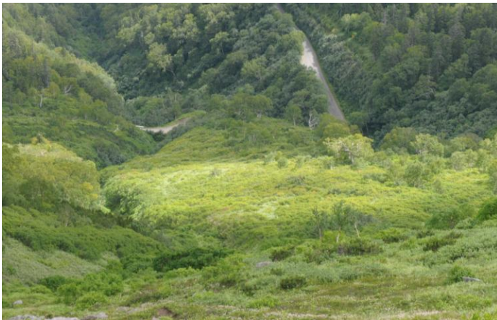
② 第1 花園下部

① 第1 花園入口の登山道上の雪渓は完全に解けていた。登山道沿いで咲いていたウサギギク、ヨツバシオガマ、ハイオトギリなどの花は全体的に終わりとなくなってきた。