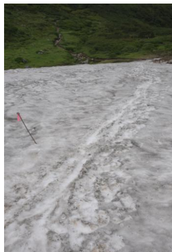
⑥ 第3 雪渓中間～下部