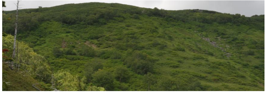
① 第1 花園全景

① 第1 花園入口の登山道上の雪渓は完全に解けていた。登山道沿いで咲いていたウサギギク、ヨツバシオガマ、ハイオトギリなどの花は全体的に終わりとなくなってきた。