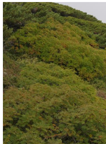
⑦ 第4 雪渓上部