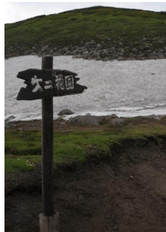
③ 第2 花園