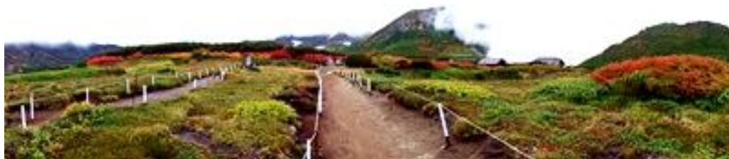
黒岳石室周辺 ～ この部所は見頃に近くなってきています

【七合目～頂上】コモチミミコウモリ↓、ミヤマアキノキリンソウ、ヤマハハコ、ダイセツトリカブト、ウメバチソウ、チシマノキンバイソウ↓、チシマヒョウタンボク実、ナガバキタアザミ↓、ミヤマサワアザミ↓、イワギキョウ