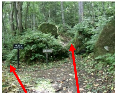
赤石川へ 紅葉滝方面へ