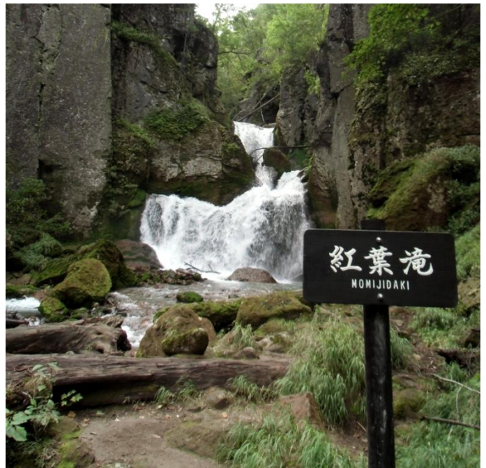
紅葉滝: 冷たい水の飛沫が寒く感じます