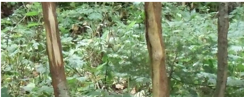
エゾシカが角を研いだ痕 (クマゲラ広場付近のトドマツ)