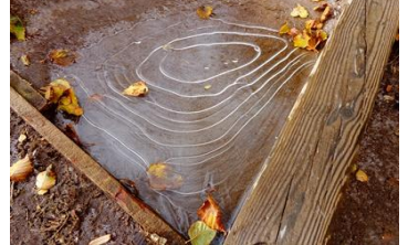
登山道(薄氷がはっています)