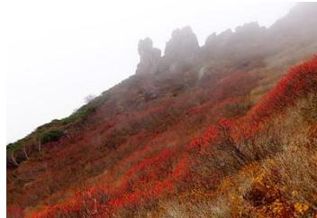
黒岳九合目周辺(まねき岩)