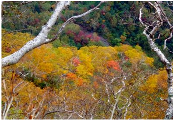
黒岳八合目周辺(黒岳沢を覗く)