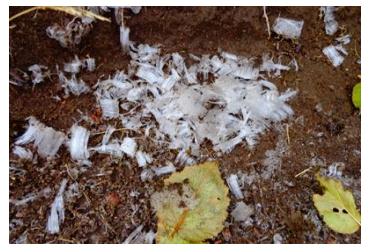
登山道の所々に霜柱が