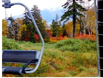
黒岳リフト乗車中