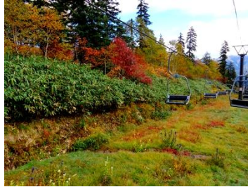
黒岳リフト乗車中