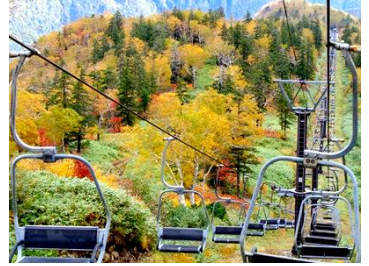
黒岳リフト乗車中