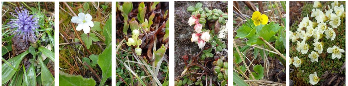
ショウジョウバカマ エゾイチゲ ウラシマトツジ コメバツガザクラ ジンヨウキスミレ イワウメ

【開花状況】【九合目】ショウジョウバカマ【頂上周辺】キバナシャクナゲ、コメバツガザクラ、ウラシマトツジ、ミネズオウ、イワウメ、メアカンキンバイ、エゾイチゲ、ジンヨウキスミレ【残雪状況】七合目～九合目標柱手前まで全面雪。九合目標柱からは断続的に登山道露出。頂上直下に約150mの急斜面雪渓あり。