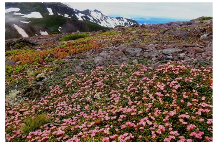
⑦黒岳頂上からポン黒岳間

⑤急斜面に約150mの雪渓。滑落要注意。⑥頂上周辺には、キバナシャクナゲやメアカンキンバイが目立ってきた。⑦頂上周辺からポン黒岳にかけて、ミネズオウやイワウメが広範囲にわたって拡がってきた。*昨年と比較すると、随分と雪どけが進んでいます。但し、天候に左右される部分が大きいです。この時期は特に装備の充実は欠かせません。ゆとりをもって安全山行を。また、5月下旬からの高温で、高山植物の開花も早めに推移しています。特に、直下では一輪ですが、早くもコマクサが開花してきています。