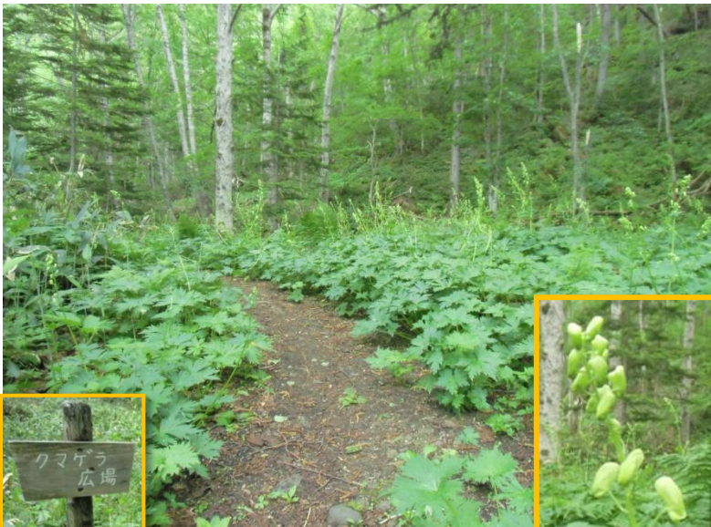
クマゲラ広場: エゾノレイジンソウ群落