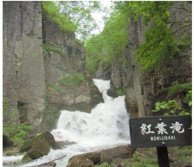
紅葉滝: 水の流れは豪快です