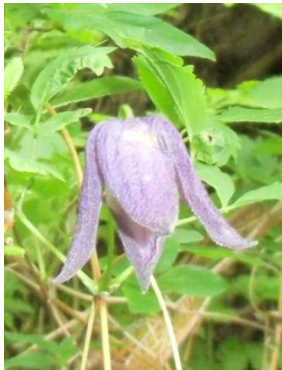
ミヤマハンショウヅル