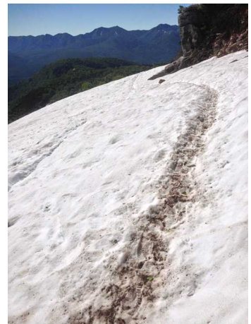
④エイコの沢ガレ場付近

緑岳稜線では、イワウメ・ミヤマリンドウ・エゾオヤマノリンドウ・ホソバウルップソウが咲いてきている。白雲小屋のテント場は、ほとんど露出しており⑤、水場も使用可能⑥。例年7月に入るとヒグマの生息が確認されて閉鎖になる三笠新道は、いまのところ通行可能だが、上部に急峻な雪面が残っており、滑落の危険がある。雪上歩行に不慣れた登山者は足を踏み入れるべきではない⑧。分岐のホソバウルップソウ群落は見頃⑦。