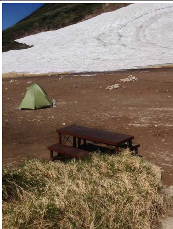
⑤白雲小屋テント場

緑岳稜線では、イワウメ・ミヤマリンドウ・エゾオヤマノリンドウ・ホソバウルップソウが咲いてきている。白雲小屋のテント場は、ほとんど露出しており⑤、水場も使用可能⑥。例年7月に入るとヒグマの生息が確認されて閉鎖になる三笠新道は、いまのところ通行可能だが、上部に急峻な雪面が残っており、滑落の危険がある。雪上歩行に不慣れた登山者は足を踏み入れるべきではない⑧。分岐のホソバウルップソウ群落は見頃⑦。