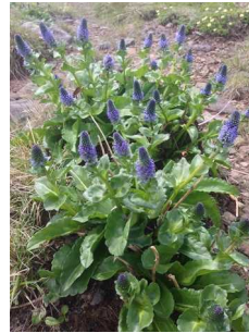
ホソバウルップソウ