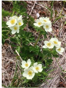
エゾノハクサンイチゲ