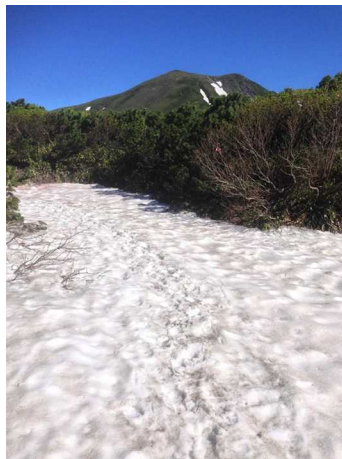
②第一第二花畑回廊部