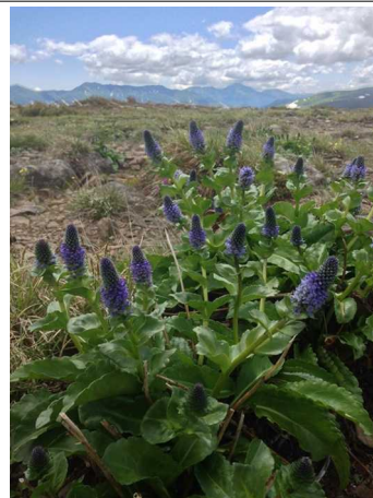
⑦三笠新道分岐周辺