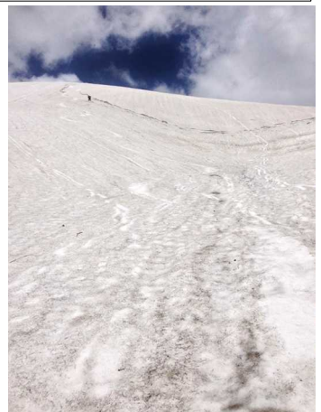
⑧三笠新道上部斜面