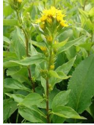
ミヤマアキノキリンソウ