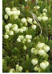
アオノツガザクラ