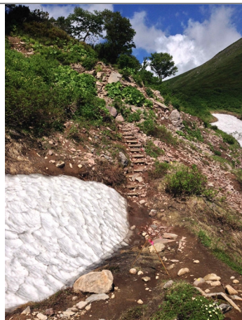
⑥エイコの沢ガレ場