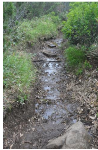
③展望台から第2花園間