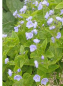
エゾヒメクワガタ