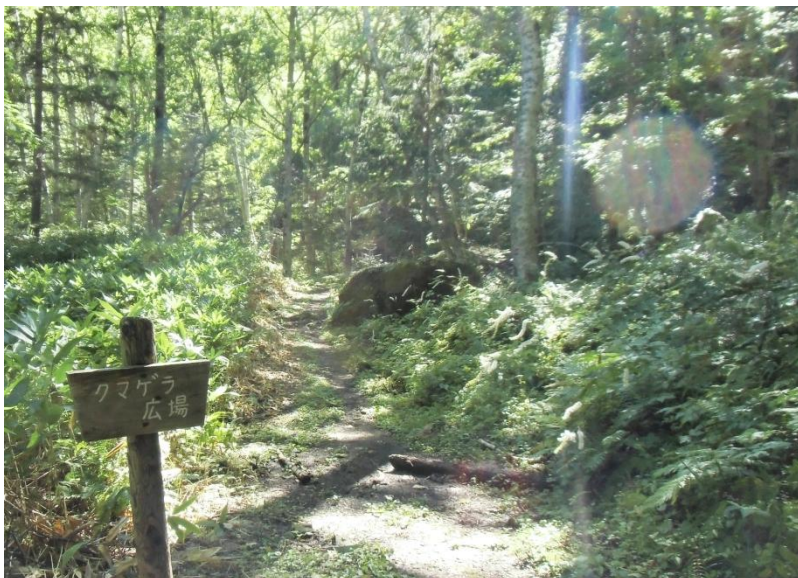
クマゲラ広場:エゾトリカブトとサラシナショウマの花が美しいコントラストを見せています