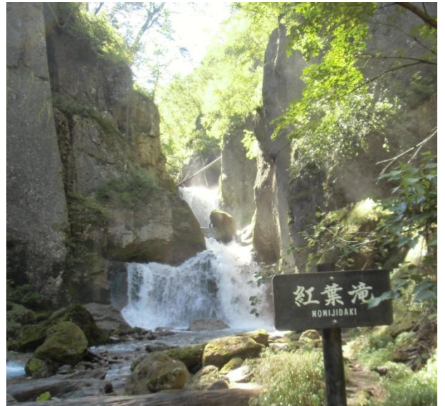
紅葉滝:朝日が当たり輝きだす流れ