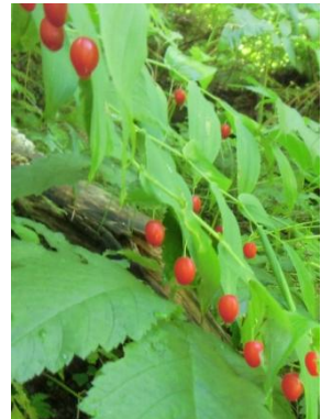
ヒメタケシマラン