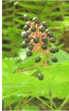
ルイヨウショウマ