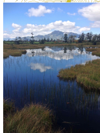
④沼ノ原湿原からトムラウシ山

ニシキ沢の徒渉点は、水量が若干多いけど①。急登上部から色づいたウラジロナナカマドが見られる②。湿原に入ってもウラジロナナカマドが色づき③、池塘には秋の気配が漂う④⑦。大沼キャンプ指定地は完全に水没し、テントを張れるスペースはない⑤。大沼ちかくの木道脇でヒグマの足跡を見つける。大きさから若い個体と思われる。沼ノ原湿原全体では紅葉の見頃期だが、茶変した葉も目立ち、部分的には折り返しに入った印象を受ける⑧。