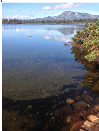
⑤大沼キャンプ指定地

ニシキ沢の徒渉点は、水量が若干多いけど①。急登上部から色づいたウラジロナナカマドが見られる②。湿原に入ってもウラジロナナカマドが色づき③、池塘には秋の気配が漂う④⑦。大沼キャンプ指定地は完全に水没し、テントを張れるスペースはない⑤。大沼ちかくの木道脇でヒグマの足跡を見つける。大きさから若い個体と思われる。沼ノ原湿原全体では紅葉の見頃期だが、茶変した葉も目立ち、部分的には折り返しに入った印象を受ける⑧。