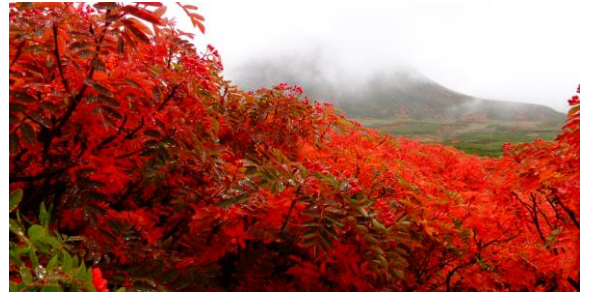
お鉢平展望台周辺