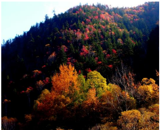
⑨三国峠 錦秋橋周辺