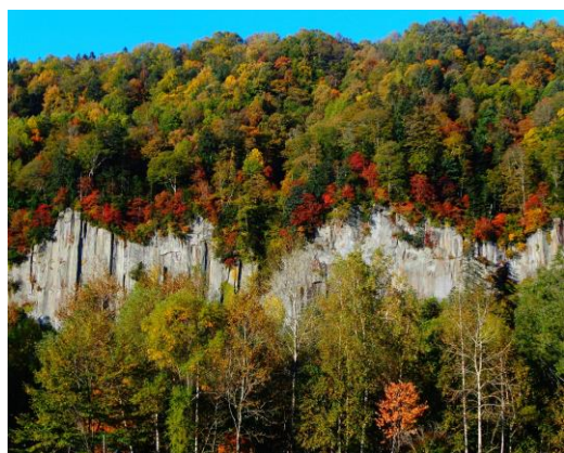
①層雲峡パークゴルフ場

【紅葉状態】 国道 39 号線の上川町から帯広に向かう三国峠間、今年も紅葉街道が始まりました。まだまだ緑葉もあるため、今後色付きが増してくると思われます。但し、今後天候が急変し山岳地帯では雪の予報、平地でも気温が低く推移するため、雪の可能性がありそうです。8月後半から黒岳石室周辺から始まった紅葉も、いよいよ終盤。昨年比約一週間早く進んだ紅葉も、結果的にはそのままの進み具合で峡谷までおりました。