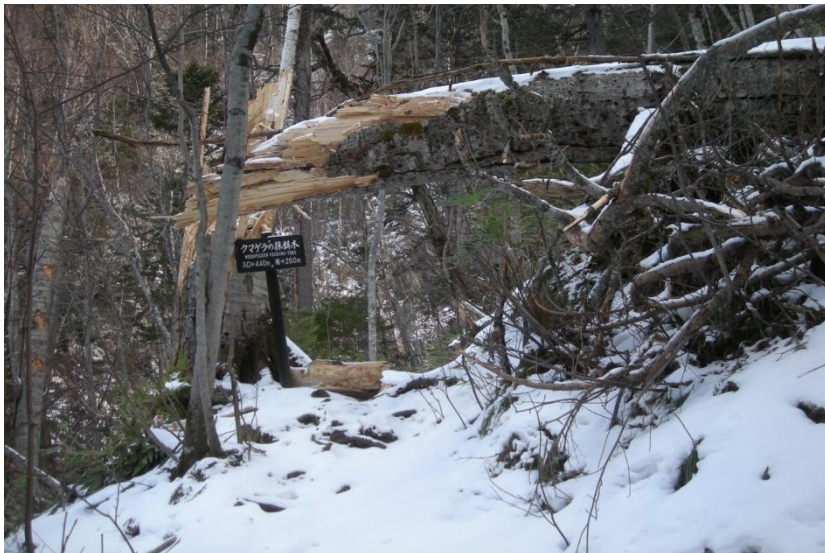
クマゲラの採餌木など三本のトドマツが周辺で倒れました