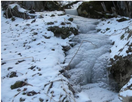
沢の水が凍り盛り上がる