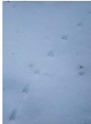
尾を引きずるネズミ