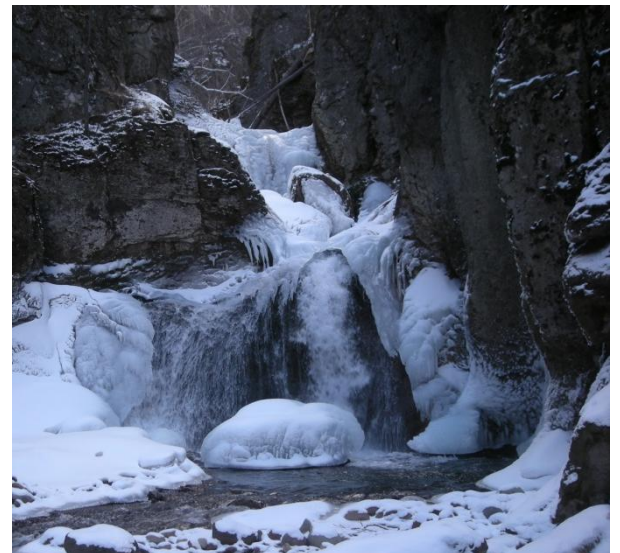
上の方と周囲が凍った紅葉滝