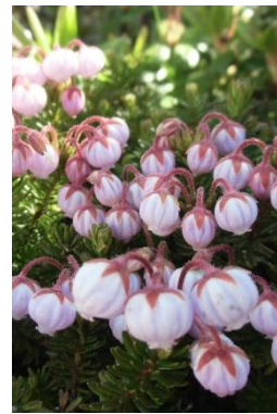
コエゾツガザクラ