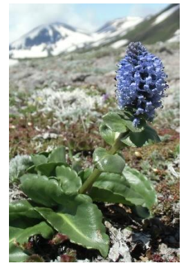
ホソバウルップソウ

開花状況 [登山口]: エゾイツツジ↑ [第一花畑]: エゾコザクラ○、アオノツガザクラ↑、コエゾツガザクラ↑、チングルマ↑、キバナシャクナゲ↓ [第二花畑]チングルマ↑ [緑岳岩塊斜面～山頂]イワウメ↑、ミネズオウ↑、ミヤマキンバイ○、メアカンキンバイ↑ [山頂～板垣分岐]キバナシャクナゲ↑、ミヤマキンバイ○、イワウメ↑、エゾオヤマノエンドウ○、ホソバウルップソウ↑ [板垣分岐～小泉分岐]キバナシャクナゲ↓、ホソバウルップソウ↑、チシアマナ↑、エゾノハクサンイチゲ↑、ウラシマツツジ↑、エゾタカネツメクサ↑、チョウノスケソウ蕾、