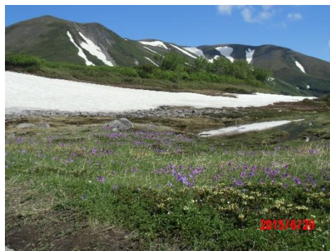
②第一花畑のエゾコザクラ