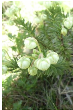
アオノツガザクラ