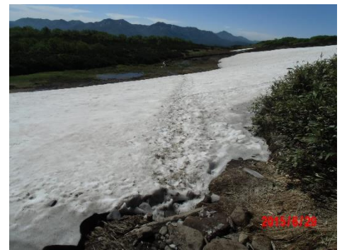
③第一花畑～第二花畑雪渓 (一部)

①第一花畑は、木道が現れています。②第一花畑のエゾコザクラが見頃を迎えています。チングルマやアオノツガザクラもピークに近づいています。③第一花畑から第二花畑に向かう方へ120mほど雪渓上を歩きます。マーキング(ピンクテープ)は雪渓末端部のみにあります。視界不良時の道迷いに注意です。