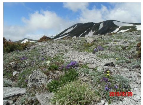
⑥板垣分岐～小泉平 (白雲岳方面)

④第二花畑周辺では、チングルマなどが咲き始めています。ここよりガレ場上部⑤までは、雪渓が2分割されています。それぞれの雪渓は、まだ広く残っており、視界不良時はルートファインディングが必要。⑤ガレ場上部付近の雪渓端下は、深くなっているので踏抜きに注意。⑥板垣分岐より小泉平は、エゾオヤマノエンドウが目立ち始めました。